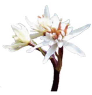
セリハオウレン 2月