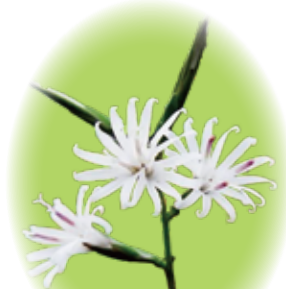
キッコウハグマ 10月