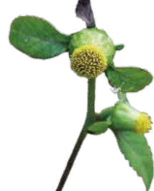
ガンクビンソウ 10月