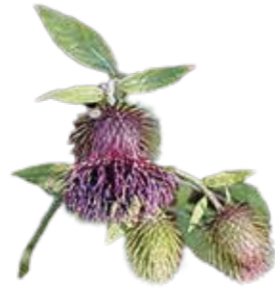
ハバヤマコトチ 8月