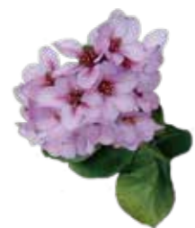
ヒマラキユキノシタ 3月