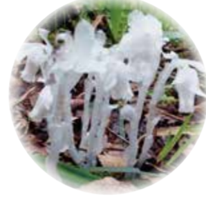
ギンリョウソウ 5月