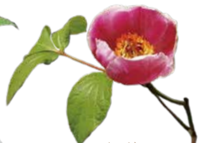
ベニバナ ヤマシャクヤク 5月