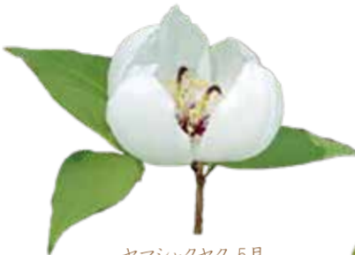
ヤマシャクヤク 5月