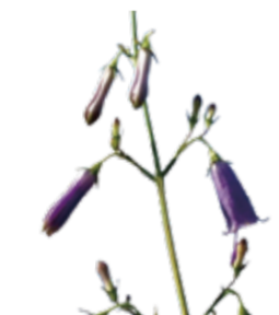
サイヨウシャシ 7月