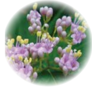
ムラサキシキブ 6月