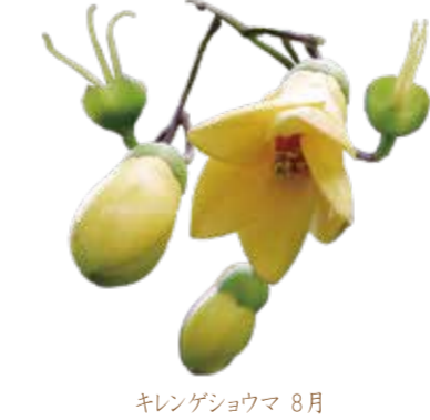
キレンゲシヨウマ 8月