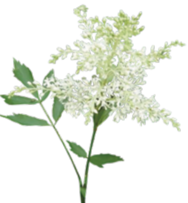
トリアシヨウマ 6月