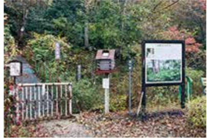
出入口付近の写真