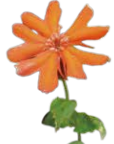
マツモトゼンノウ 8月