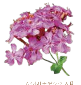
ムシリナデシコ 6月