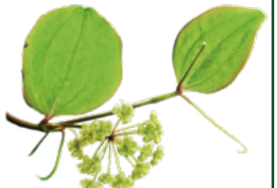
サルトリイバラ 4月