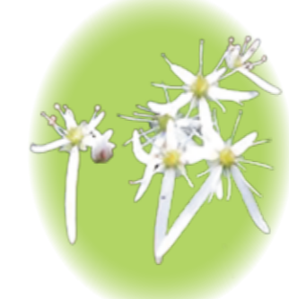
ダイモンジソウ 10月