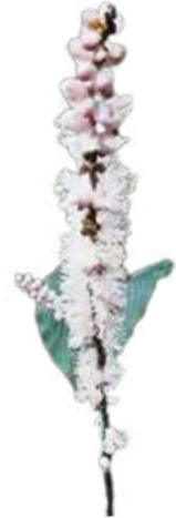
オオバシヨウマ 8月