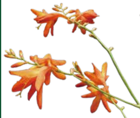
ヒメヒオウギセン 7月